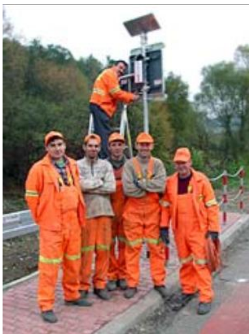
Ekipa Zakładu Zabezpieczenia Ruchu Drogowego z Krakowa