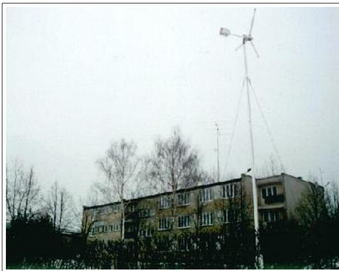
Siłownia wiatrowa o mocy 1,2 kW

Pracownia składa się z instalacji solarnych, fotowoltaicznych, pompy ciepła, siłowni wiatrowej i pomyślana jest głównie pod kątem dydaktycznym. Kolektory słoneczne i ogniwa fotowoltaiczne zainstalowane są na specjalnie do tego celu zaprojektowanej platformie. Energia termiczna pozyskiwana z urządzeń solarnych oraz pompy ciepła wykorzystywana jest do podgrzewania ciepłej wody użytkowej, z której zasilane są prysznice w natryskach przy sali gimnastycznej oraz w toaletach uczniowskich. Dolnym źródłem pompy ciepła jest studnia betonowa z wbudowanym wymiennikiem ciepła w postaci węzownicy.