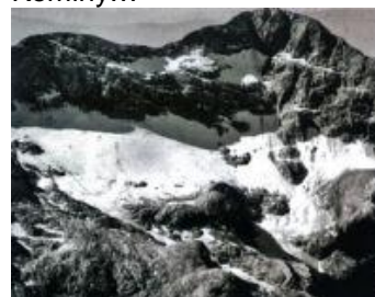
Lodowiec Triglav, 1971